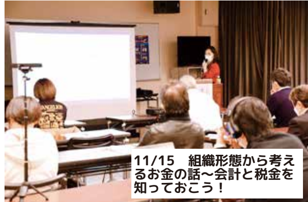
11/15 組織形態から考えるお金の話～会計と税金を知っておこう！