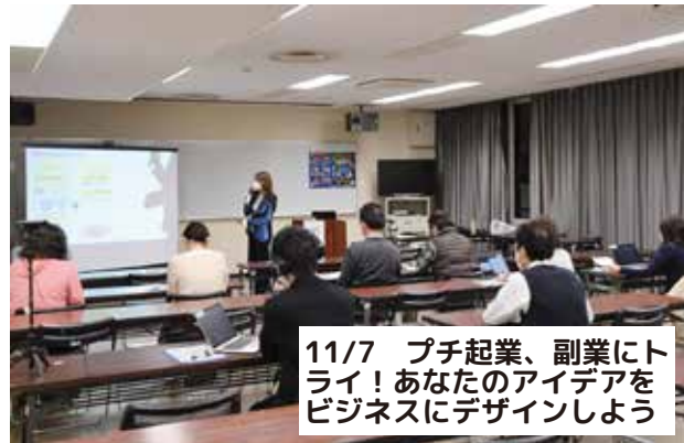
11/7 プチ起業、副業にトライ！あなたのアイデアをビジネスにデザインしよう