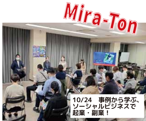
10/24 事例から学ぶ、ソーシャルビジネスで起業・副業！

第2部と第3部は、ZOOMでも多くの方が参加されました。これからの、 富田林の未来 を担う人材の育成、起業や副業へのキッカケ、ヒントになったのではないのでしょうか？