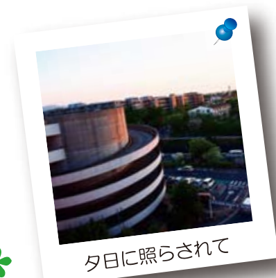
夕日に照らされて